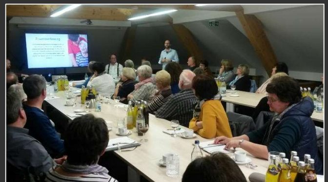
Rathausitzungssaal: Infoveranstaltung für die Seniorenbeauftragten des Unterallgäus