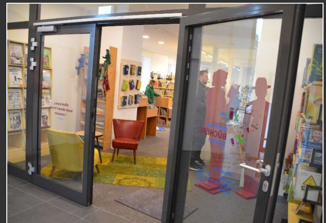
1. Obergeschoss: Bücherei